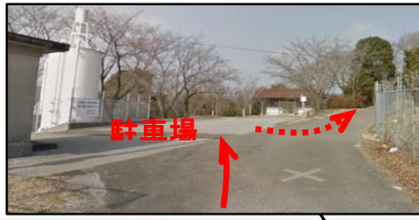
駐車場（下車）→ 徒歩直進